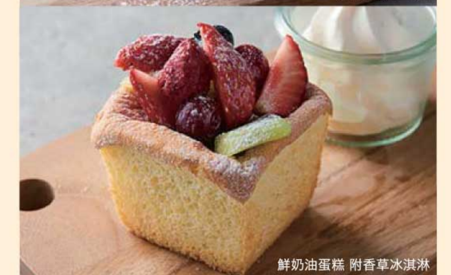
鮮奶油蛋糕 附香草冰淇淋