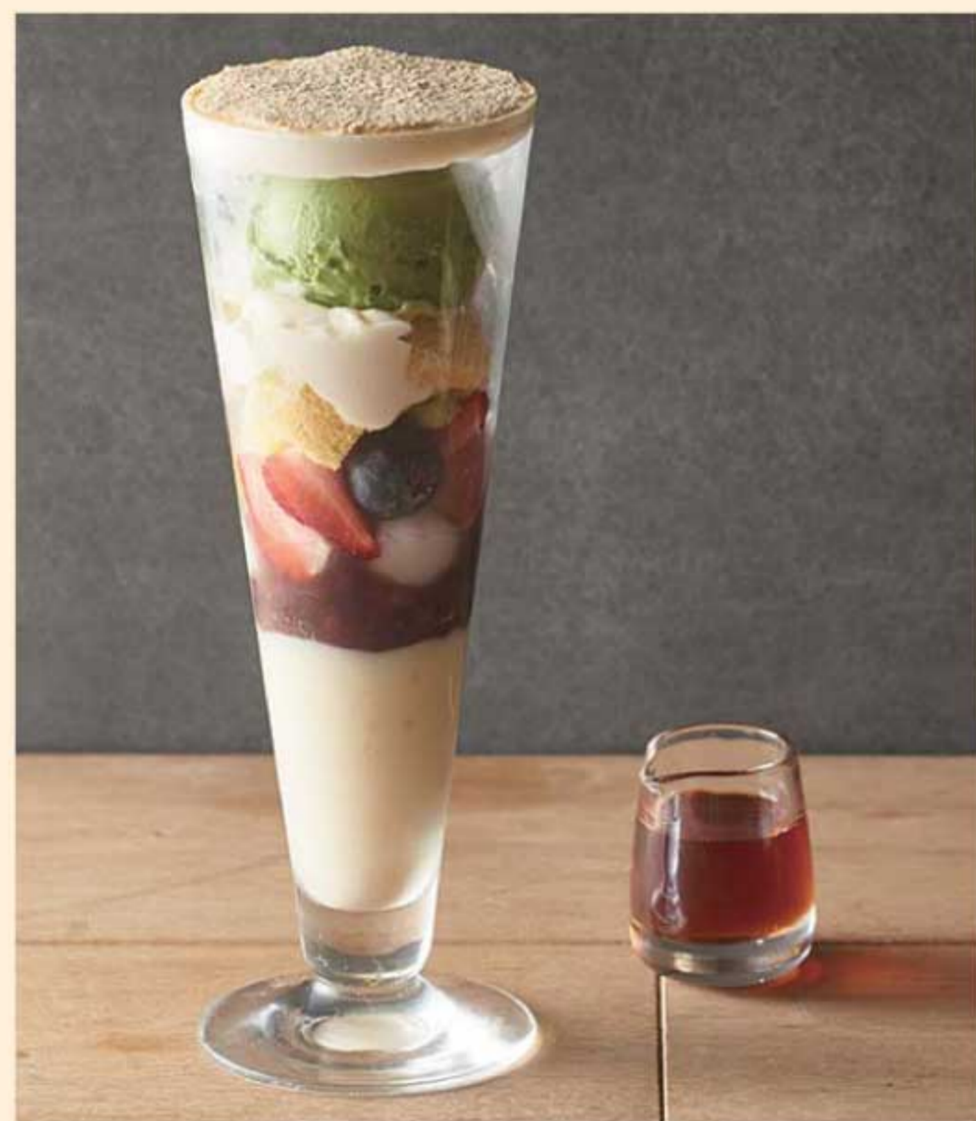
吉祥庵黃豆粉的水果聖代