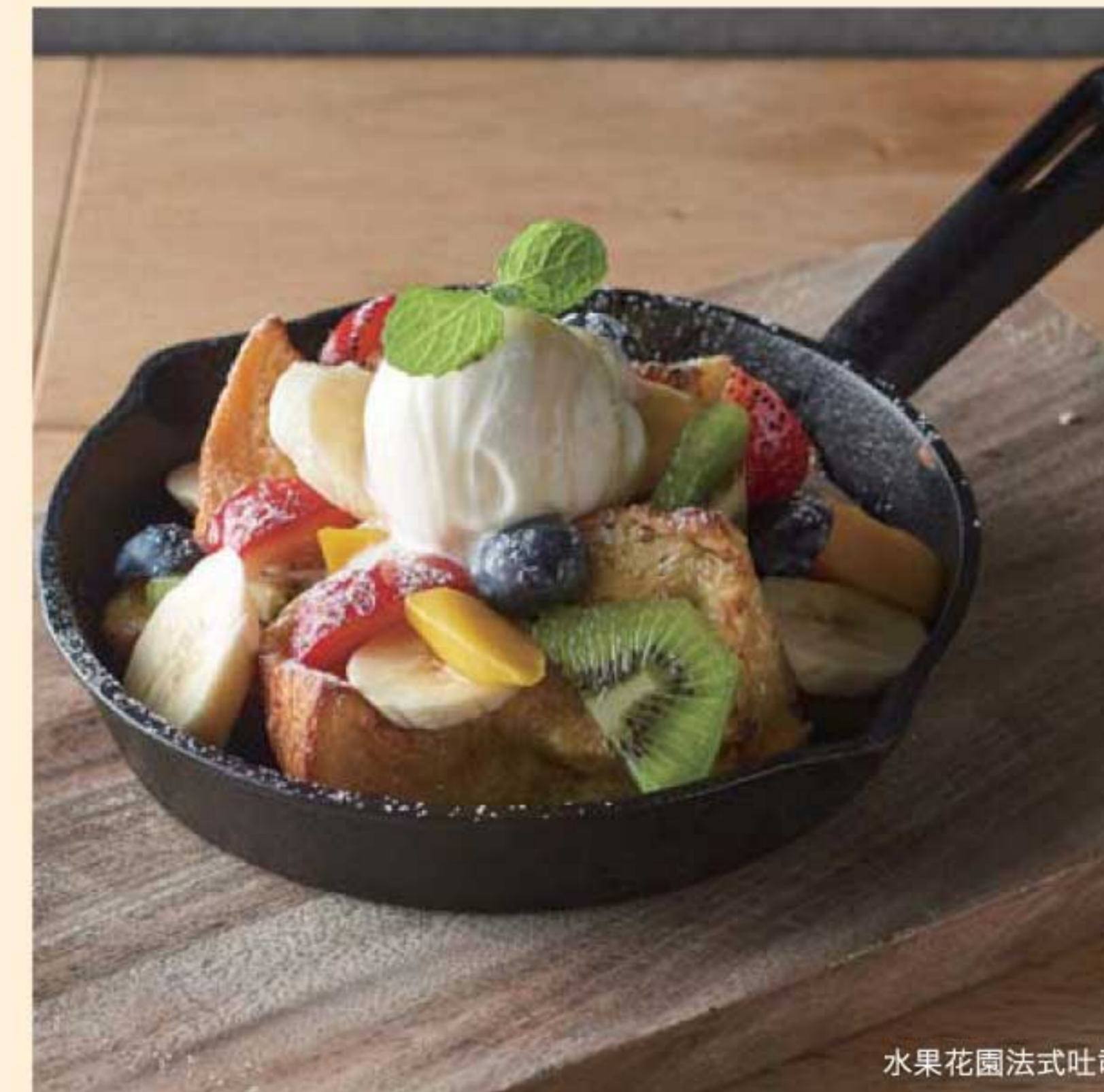
水果花園法式吐司