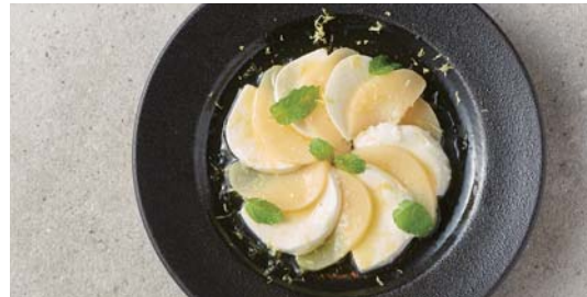
白桃のカプレーゼ レモン&ミント