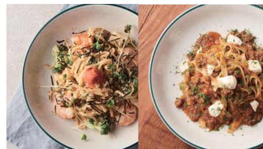
〈鰯卵屋〉明太子クリームパスタ