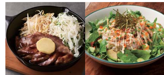
豚肩ロースの渋谷トンテキ