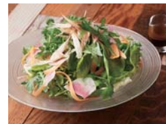
ジャパニーズハーブサラダ