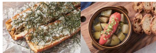
ガーリックしらす海苔トースト

バゲット baguette: +¥250 / カンパニーヌ Campagne: +¥250