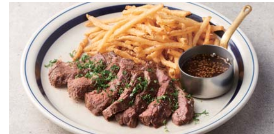
牛カインミのステーキ&フリット わさびソース添え