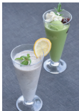
右：白餡クリーム抹茶セーキ 左：丹波黒豆と季節フルーツの ミックスジュース